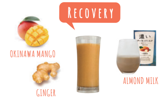
沖縄マンゴー&ジンジャー [アーモンド・りんご] OKINAWA MANGO & GINGER ¥ 990