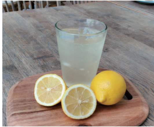
瀬戸内レモンの 自家製アイスレモネード SETOUCHI LEMON LEMONADE (ICED) ¥ 693

瀬戸内はとびしまで丁寧に育てられたノーワックスのレモンの爽やかなドリンクをお楽しみください。